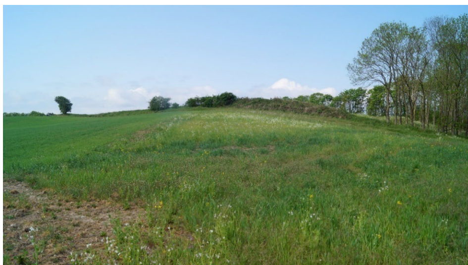
Ukurant og næringsfattig hjørne af marken er her taget ud til brak og giver en gevinst for både diget og læhegnet i baggrunden.

På ny-udlagte brakarealer kan du holde øje med, hvilke urter der kommer og dominerer det første år, og det vil udvikle sig over årene. Vildtet vil ofte også finde ophold i brakområderne, særligt hvis de ligger op ad noget eksisterende krat og arealer med lavt græs. Hvis der har indfundet sig blomster, og herunder også tidsler, vil du en varm sommerdag kunne opleve mange sommerfugle og bier, som søger nektar.